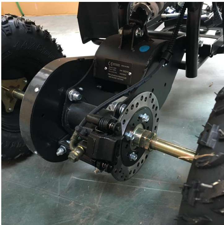
Zadní hydraulická brzda