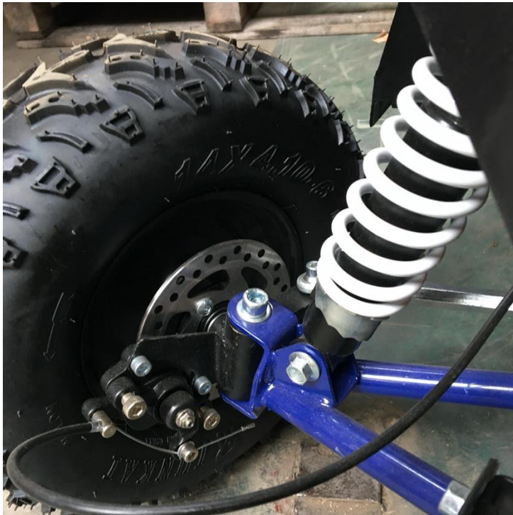
Přední mechanická brzda