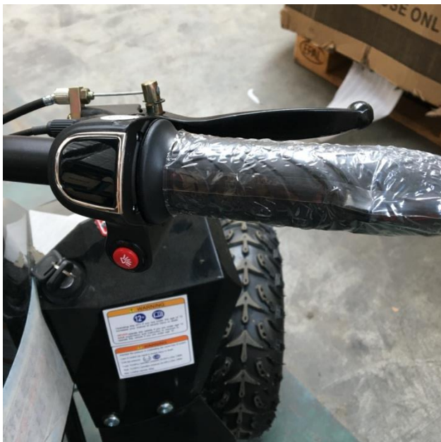
Ukazatel stavu baterie