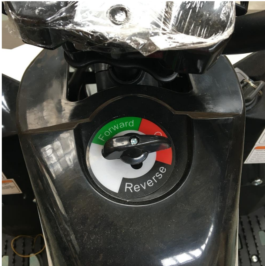
Přepínač – Vpřed / Vypnuto / Vзад